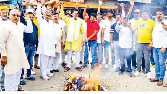
खरखोड़ा। डोनाल्ड ट्रॉफ का पुतला फूंकते भाजपा कार्यकर्ता।