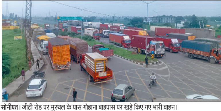
सोनीपत। जीटी रोड पर मुरथल के पास गोहाना बाइपास पर खड़े किए गए भारी वाहन।

अस्थायी पार्किंग में ले जाए गए भारी वाहन, हाइवे पर परेशान रहे वाहन चालक, बाद में केजीपी, केएमपी के रास्ते भारी वाहनों को किया गया रवाना, पुलिस ने बड़ी, कुराड़, कुंडली बाइपास और राजीव गांधी एजुकेशन सिटी में बनाई है अस्थाई पार्किंग