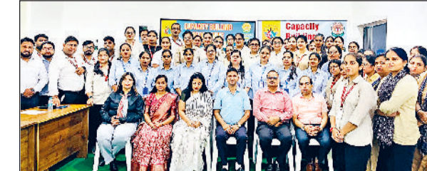
मोहना। प्रशिक्षण कार्यक्रम में उपस्थित प्रशिक्षक व प्रशिक्षु शिक्षक।