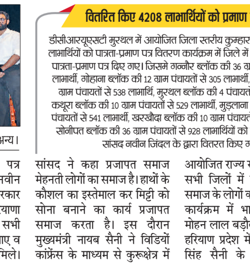
सांसद ने कहा प्रजापत समाज मेहनती लोगों का समाज है। हाथों के कौशल का इस्तेमाल कर मिट्टी को सोना बनाने का कार्य प्रजापत समाज करता है। इस दौरान मुख्यमंत्री नायब सैनी ने विडियों काफ्रेस के माध्यम से कुरुक्षेत्र में