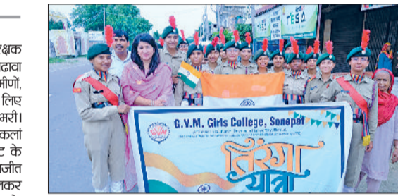
सोनीपत। तिरंगा यात्रा में शामिल जीवीएम गर्ल्स कॉलेज की छात्राएं।