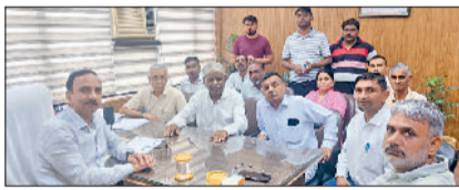
सोनीपत। एचएसवीपी कार्यकारी अभियंता से वार्ता के लिए पहुंचे यूनियन का शिफ्टमंडल।

सोनीपत। हरियाणा संयुक्त कर्मचारी मंच के बैनर तले कौशल रोजगार निगम और हुड्डा जन स्वास्थ्य कर्मचारी यूनियन के कर्मचारियों ने बुधवार को एचएसवीपी कार्यालय सेक्टर-15 में सुबह से धरना और रोष प्रदर्शन शुरू किया। प्रदर्शनकारियों ने हरियाणा सरकार, एचएसवीपी