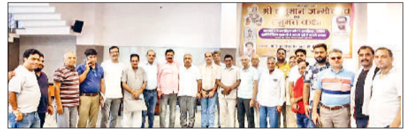
गोहाना। समारोह की तैयारी को लेकर विचारविमर्श करते ट्रस्ट के प्रतिनिधि।