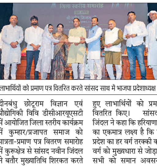
लाभार्थियों को प्रमाण पत्र वितरित करते सांसद साथ में भाजपा प्रदेशाध्यक्ष व अन्य।

सोनीपत। कार्यक्रम में पहुंचे अतिथियों का स्वागत करते हुए।