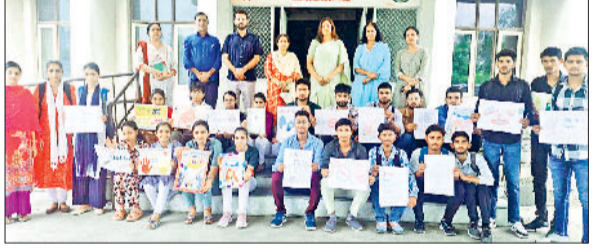
खरखोड़ा। पोस्टर मैकिंग प्रतियोगिता के प्रतिभागी विद्यार्थी।