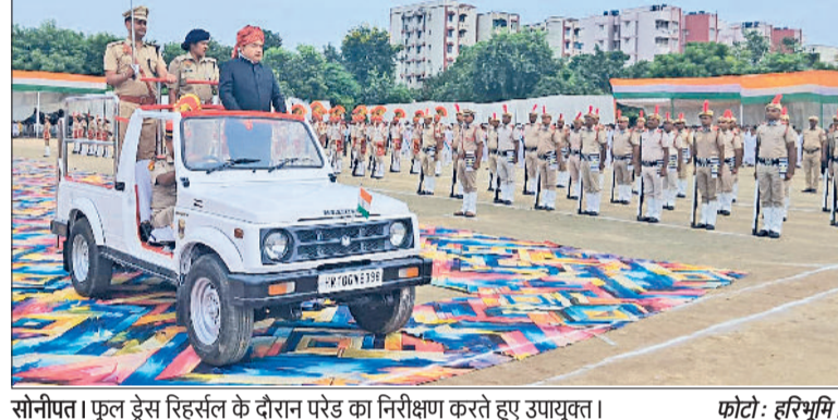
सोनीपत। फुल ड्रेस रिहर्सल के दौरान परेड का निरीक्षण करते हुए उपायुक्त।