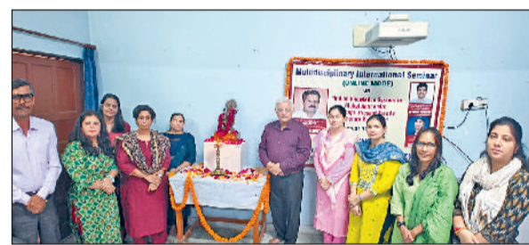
सोनीपत। संगोष्ठी के मौके पर महाविद्यालय के प्राचार्य साथ में अन्य।

टीका राम शिक्षा महाविद्यालय द्वारा वैश्विक शिक्षा जगत में भारतीय ज्ञान प्रणाली: अवधारणा, वर्तमान रुझान और भविष्य की संभावनाएं विषय पर, उच्चतर शिक्षा निदेशालय द्वारा अनुमोदित बहु-विषयक अंतर्राष्ट्रीय संगोष्ठी का आयोजन ऑनलाइन मोड में किया गया। इस आयोजन में देश के अधिकांश राज्यों तथा 9 अन्य देशों के 178 शिक्षाविदों, शोधार्थी एवं छात्रों ने भाग लिया। कार्यक्रम का शुभारंभ मुख्य